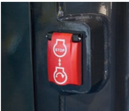
Interruttore secondario di spegnimento motore