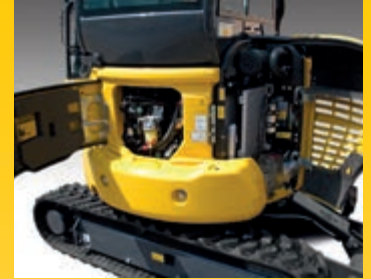
Cofani posteriori per controllo del motore, rifornimento carburante, ispezione e pulizia dei radiatori ed accesso alla batteria

L'adozione di connettori idraulici a faccia piana ORFS ed elettrici di tipo DT non solo aumenta l'affidabilità, ma rende più facili e rapidi eventuali interventi di riparazione. Boccole ad alta durabilità e un intervallo di 500 ore per la sostituzione dell'olio motore riducono ulteriormente i costi operativi.