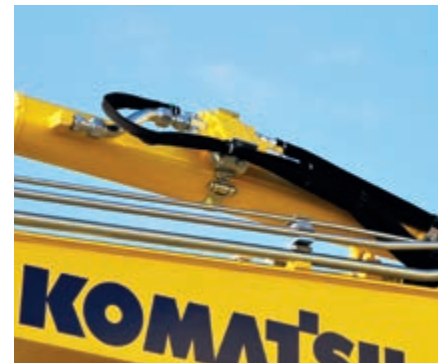
Valvole di sicurezza cilindri braccio e avambraccio