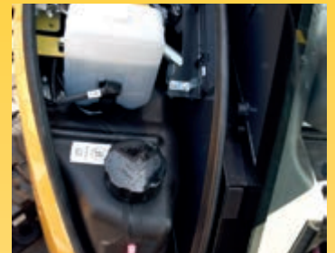
Rifornimento comodo e sicuro di olio e carburante sotto il cofano anteriore