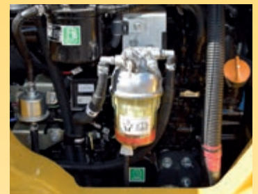
Grande filtro e prefiltro del carburante con separatore di acqua per proteggere il motore